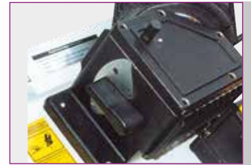
Drei Geschwindigkeiten › Über Getriebe schaltbar