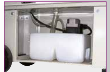
Kühlmitteleinrichtung › Im Unterbau integriert › Behälterinhalt 11 Liter