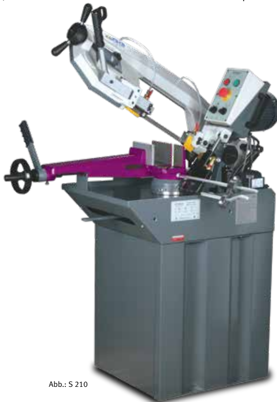
Abb.: S 210